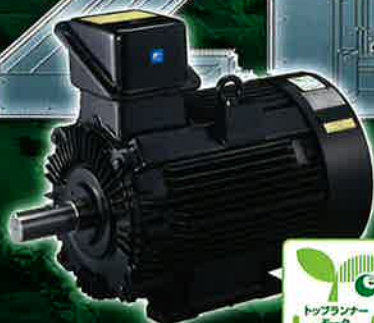
プレミアム効率モータ