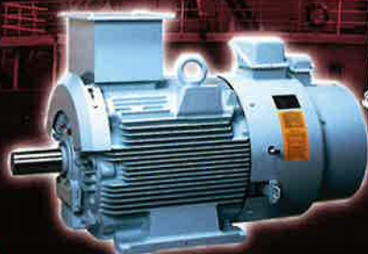
ベクトル制御インバータモータ